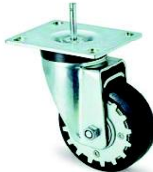
Spezial Rollen Special castors