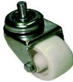
Spezial Apparaterollen Gewinde M10 Special apparatus castors with thread M10