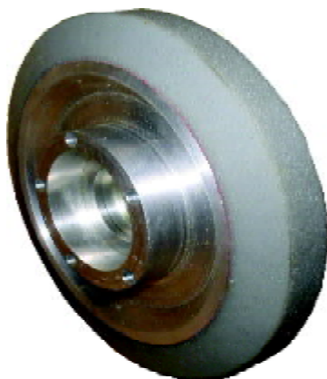
Antistatische Räder in Spezialausführungen Special-antistatic wheels