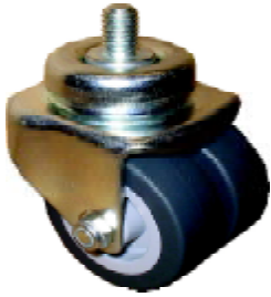
Spezial Apparaterollen Gewinde M10 Special apparatus castors thread M10