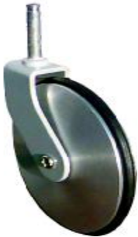
Designerrollen Design castors