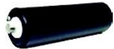
Tragrollen idler wheels