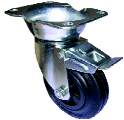
Spezialrolle ø 125mm mit Bauhöhe 183mm Special castors ø 125mm with height 183mm